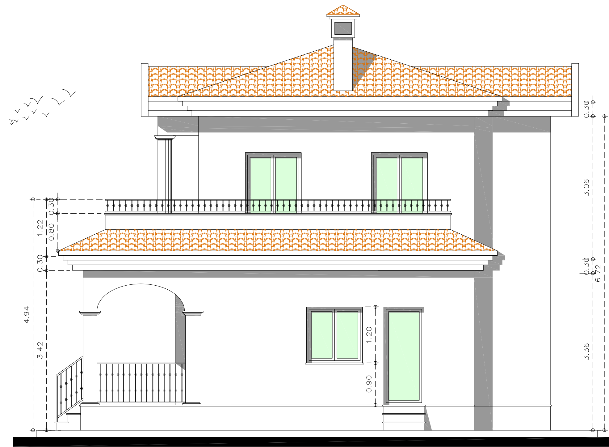
ALZADO LATERAL DERECHO