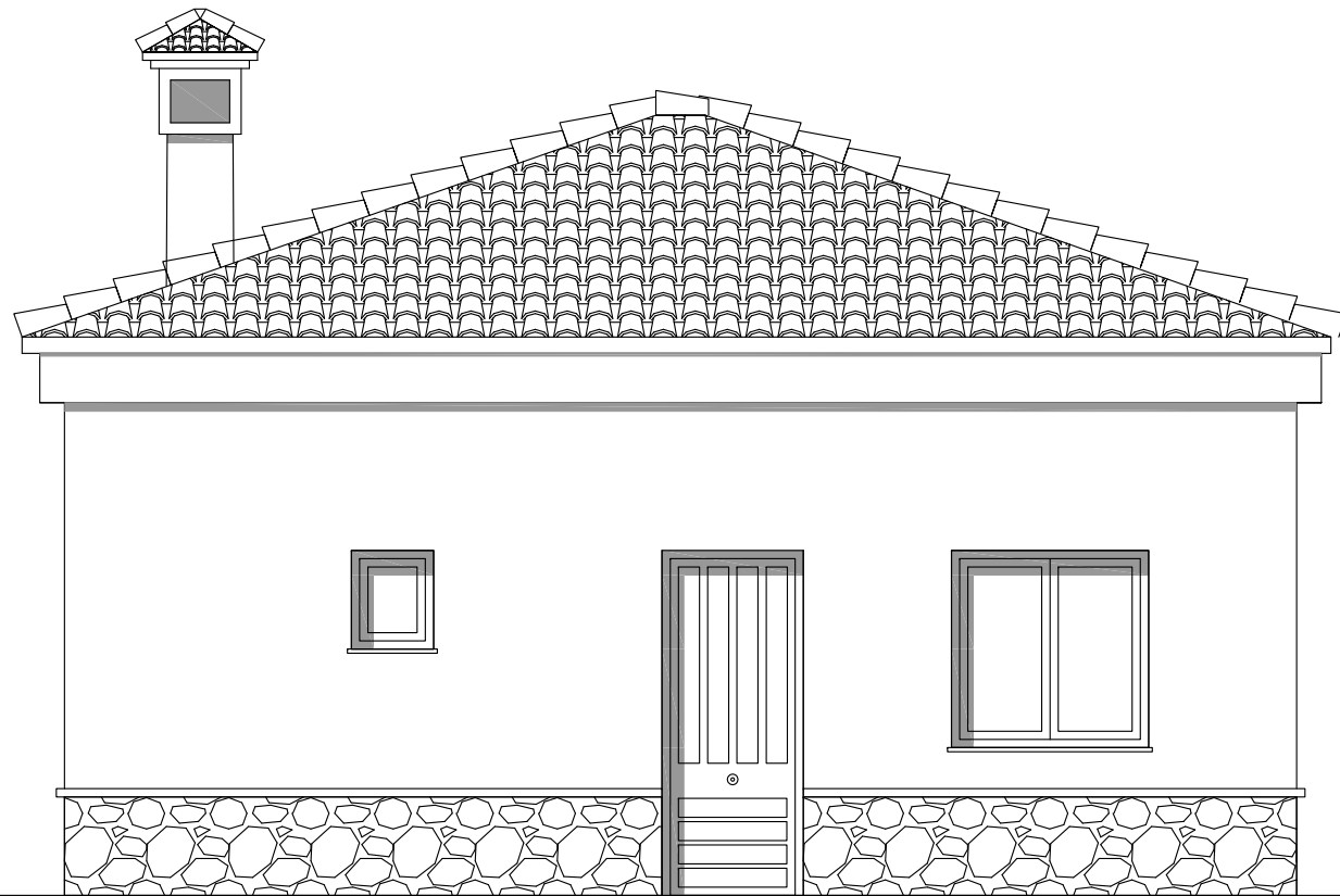
ALZADO LATERAL DERECHO